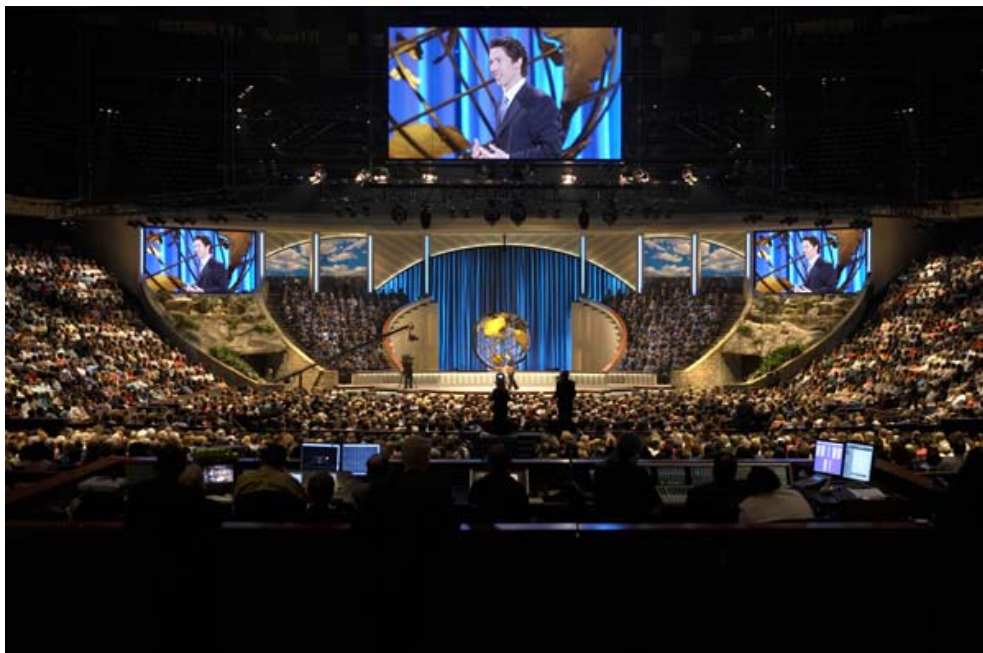
Joel Osteen en la colosal Lakewood Church

Uno de los principales valedores del “mensaje positivo”, de la “confesión positiva”, “pensamiento positivo”, “optimismo a ultranza” es sin duda alguna Joel Osteen, el pastor de la congregación más grande de Estados Unidos, Lakewood Church, in Houston, Texas.