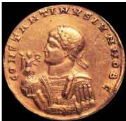
"Moneda con la representación del emperador romano Flavio Valerio Constantino"

Es curioso observar que hoy en día, una parecida táctica como la de Nerón opera contra la verdadera Iglesia de Jesucristo, a través de "modelos" y falsos sistemas eclesiales como, entre otros, el G12 (gobierno de doce) y sus "encuentros", presentándose este último como la última revelación de Dios para la Iglesia para estos días finales.