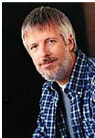
"El novelista Frank Peretti"

Este relato que les he ofrecido es la descripción exacta y concisa de uno de algunos episodios similares, que están ocurriendo concretamente en una congregación de Cristo. Lo conocemos bien, así como conocemos a los testigos, Esteban y Sofía (no son sus verdaderos nombres).