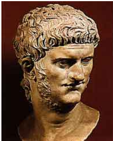
“Busto de Nerón”

Hoy en día, el buen creyente promedio, por vivir en un medio de escasa o nula persecución, es sencillo como paloma, pero no es prudente como serpiente, sino que es muy confiado e ingenuo, y el enemigo ha estado tomando una incommensurable ventaja de todo ello, y ya por años. Le es muy difícil al creyente promedio pensar que tal maldad pueda llegar a existir; pero no tenemos excusa, ya que la Biblia es muy clara en cuanto a todas sus advertencias al respecto.