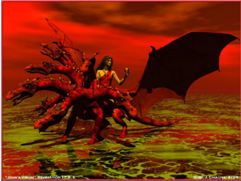
“Representación de la Gran Ramera”