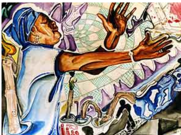
“Haciendo brujería utilizando gestos y signos”

Con esa brujería, intentan “preparar” el ambiente espiritual de la congregación, para posteriormente efectuar siempre que les sea posible su definitiva infiltración, llegando a hacerse pasar por verdaderos creyentes, siendo muy amables, especialmente con los responsables de la congregación, ofreciéndose para ayudar en lo que sea, buscando el llegar a ser casi “imprescindibles”.