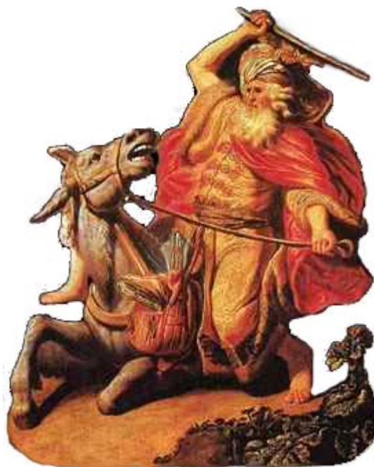
Balaam golpeando a su mula que le increpaba. Balaam, el falso profeta por excelencia.