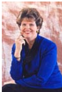
Cindy Jacobs, profetisa dominionista/neo reformista.

Recuerdo los mensajes de una afamada profetisa norteamericana que viene muy a menudo a España. Profetizaba a todos los presentes en un congreso cosas así: “ Así dice el Señor: El avivamiento llegará en el año 2003 a España ” (el año 2003 llegó, y pasó, y no ocurrió nada). Curiosamente, el mismo mensaje lo dio Benny Hinn cuando vino a Barcelona hace ya varios años.