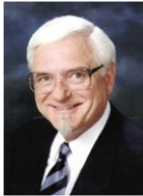
C. Peter Wagner

¿Cómo es que no dicen la verdad? ¿Es que no la conocen?