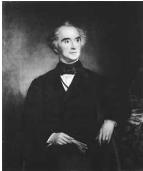
“Lo scienziato Justus Von Liebig”

Quei quattro scalini li chiama così: Conquistare, Consolidare, Discepolare ed Inviare . Questa sarebbe la " Scala del Successo ", un appellativo un po' strano per definire il Gran Mandato che nostro Signore Gesù Cristo diede da compiere alla Chiesa, ( Mr 16: 14-18; Lc. 24: 36-49; Giov. 20: 19-23 ).