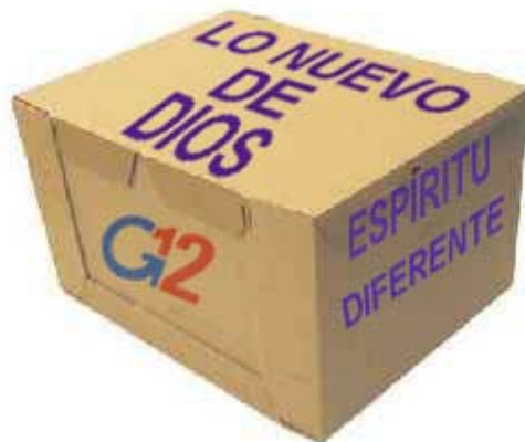
Le cose nuove di Dio?

Quando si dice che Dio sta facendo “qualcosa di nuovo”, dobbiamo presupporre che le “cose vecchie di Dio” debbano essere scartate. Ciò nonostante, Dio non ha niente di “vecchio”. Quello che è stato, è lo stesso di quello che è ora ( Ecclesiaste 1:9-10 ).