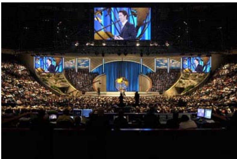
Joel Osteen nella colossale Lakewood Church

Uno dei principali protettori del “messaggio positivo”, della “confessione positiva”, “pensiero positivo”, “ottimismo senza limiti” è senza dubbio alcuno Joel Osteen, il pastore della congregazione più grande degli Stati Uniti, Lakewood Church, a Huston, Texas.