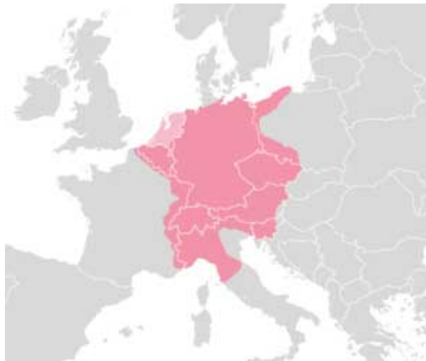
“Mapa de la ocupación del llamado Sacro Imperio Romano Germánico”

Poco después, y una vez disuelto ese imperio, surge el Sacro Imperio Romano Germánico, que fue la unión política de un conglomerado de estados de Europa Central que se mantuvo desde la Edad Media hasta inicios de la Edad Contemporánea. Formado en el año 962, el Sacro Imperio fue la entidad predominante de Europa central durante casi un milenio, hasta su disolución oficial en 1806 por Napoleón I.