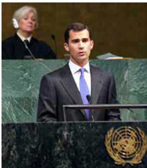
“Felipe de Borbón, príncipe de España compareciendo en la sede de la ONU”

Todo el mundo sabe que España, desde hace pocos años, surgió prácticamente de la nada en el plano europeo, hasta convertirse en lo que es ahora, en un singular potencia económica mundial, con un amplio margen en las relaciones con el extranjero, y en concreto con toda Latinoamérica. Por ejemplo, en todas las tomas de gobierno presidencial de los países iberoamericanos, asiste como invitado muy especial el príncipe Felipe de España, produciéndose un enorme impacto cuando hace su aparición en público.