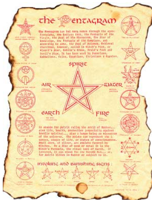
“El pentagrama; un modelo ocultista”

No cabe duda, decimos, que existe un significado en ese sentido cuando en la bandera de Europa se muestran doce estrellas en círculo perfecto, cada una de ellas de cinco puntas.