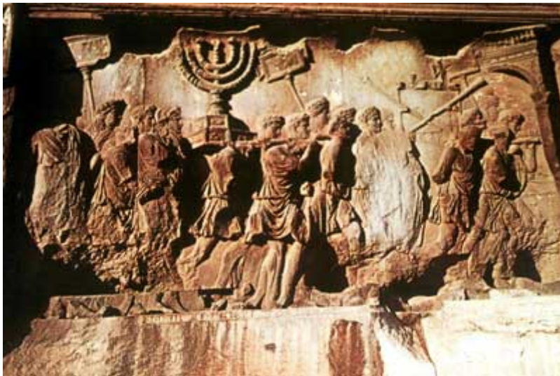
“Detalle del relieve del Arco de Tito, en el cual se ven los objetos sustraídos del Templo de Jerusalén, y llevados a Roma – año 70 d.C.”

Los romanos fueron los autores de la dispersión final de los judíos por toda la tierra. La última dispersión fue la realizada por el emperador romano Adriano (por cierto, de origen español) cuando un movimiento armado anti-romano sacudió el interior de Judea, mandado por Simón bar Kojba (el Hijo de la Estrella). Corría el año 135 d.C.