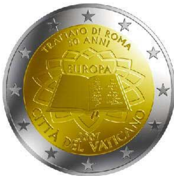
“Moneda de dos Euros conmemorativa del 50 aniversario del Tratado de Roma. Fíjese en el detalle: Ciudad del Vaticano”

La vinculación con Roma es indiscutible. Para apoyo a todo esto, apporto un dato reciente, de fecha mayo del 2004. El actual presidente español, José Luis Rodríguez Zapatero entregó a Roma, en detrimento de Madrid, la firma de la Constitución Europea, afirmando él lo siguiente: “el sitio natural para la firma de la Constitución Europea es Roma, la ciudad donde comenzó este gran proyecto con el Tratado de Roma” (1) Evidentemente, eso no obedeció a ligereza, ni casualidad alguna. Estaba suficientemente premeditado y preelaborado, aun que resultó a la postre simple barro , ya que esa Constitución jamás prosperó, hasta la fecha.