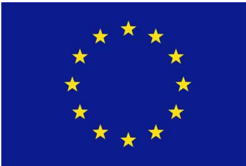
“La bandera de la Unión Europea”

Consideremos pues dicha bandera con detalle: Son doce estrellas de oro de cinco puntas, dispuestas en círculo sobre un fondo azul. Analicemos el significado de todo esto por partes.