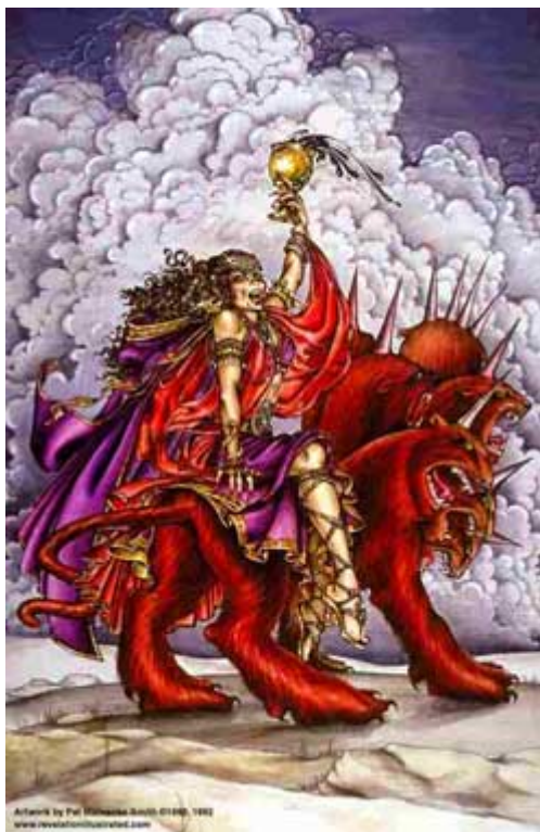
“Representación de la mujer ramera de Apocalipsis 17”

“Vino entonces uno de los siete ángeles que tenían las siete copas, y habló conmigo diciéndome: Ven acá, y te mostraré la sentencia contra la gran ramera, la que está sentada sobre muchas aguas, con la cual han fornicado los reyes de la tierra, y los moradores de la tierra se han embriagado con el vino de su fornicación” (Apocalipsis 17: 1, 2)