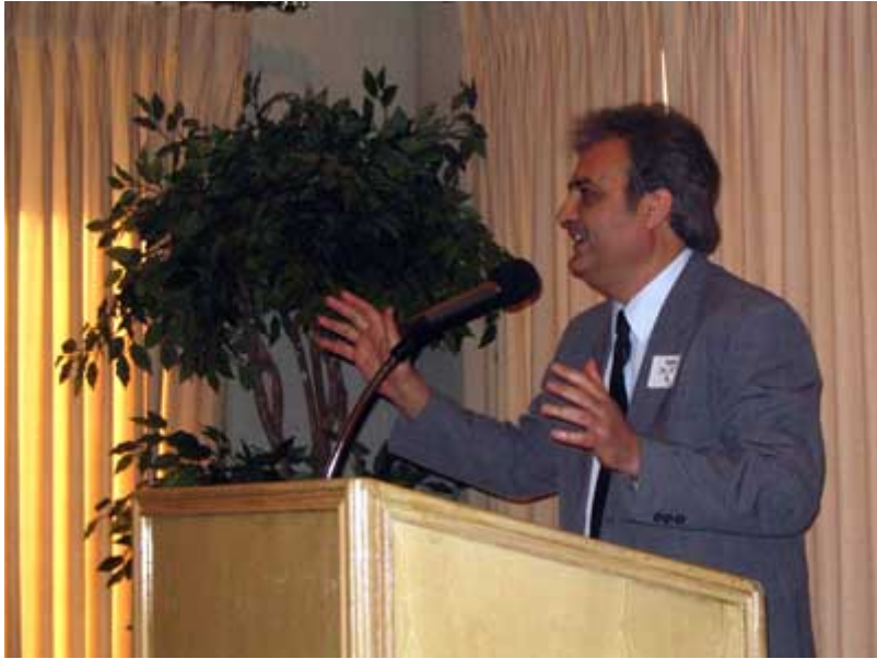
Durante mi alocución en el Cimarron Country Club.