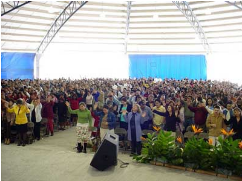
La congregación de la iglesia de Reynosa el domingo por la mañana.