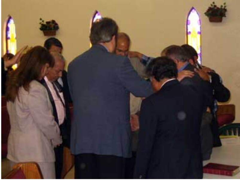
Orando por el alcalde de Pharr, D. Leopoldo Palacios .

Me asombró tal evento, ¡qué bueno si eso ocurriera también en España tal y como allí! Es menester decir que se estima que el 40% de la población del “Rio Grande Valley” es evangélica.