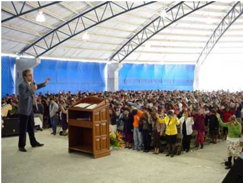
Ministrando en Reynosa (México)

Expresamente invitado por Bolainez Ministries Inc., así como por dos iglesias de Texas y México respectivamente, a saber, el Divino Redentor de Mission, Texas, y la perteneciente a la Alianza Cristiana y Misionera de Reynosa, México, llegué a McAllen, Texas, (E.U.A.), procedente de Madrid, España, el día 30 de Enero del corriente. Un muy largo viaje.