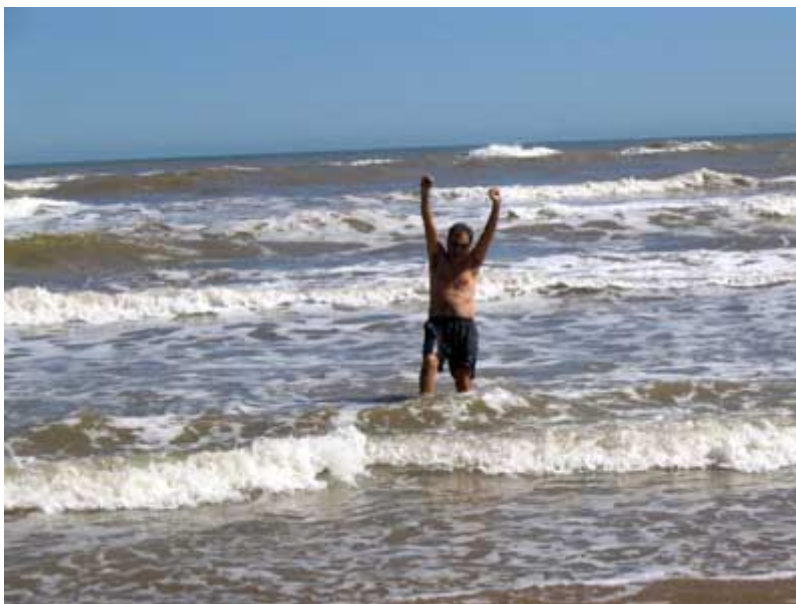
¡Qué frío está el mar en Febrero!

Llegamos a Padre Island, cerca de Brownsville, donde pasamos un rato agradable en un día de sol, en pleno invierno (casi verano para nosotros aquí en España); hasta probé las frías aguas del Golfo de México, para asombro de ellos.