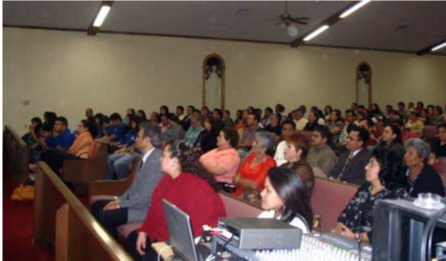
El templo estaba lleno, y la gente sumamente atenta.