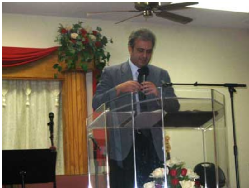
Durante mi turno en el evento "Contrarrestando las Doctrinas Heréticas"