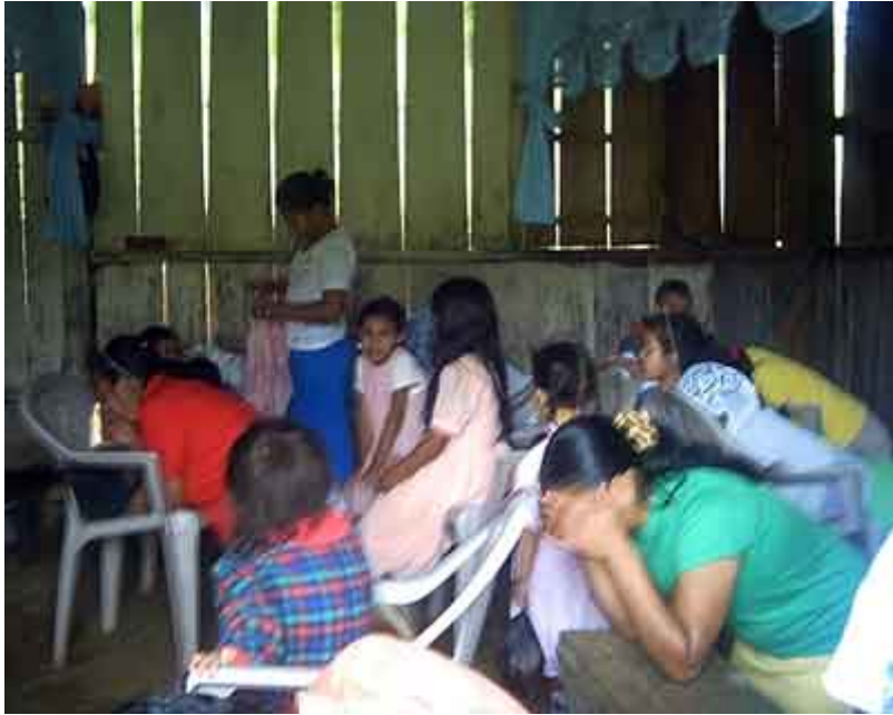
“El interior del templo, donde se reúne la pequeña, pero ferviente iglesia”

En el “G12: Crónicas de Nicaragua” , he escrito acerca de esos “encuentros”, pero en este apartado, seguiremos hablando de ello.