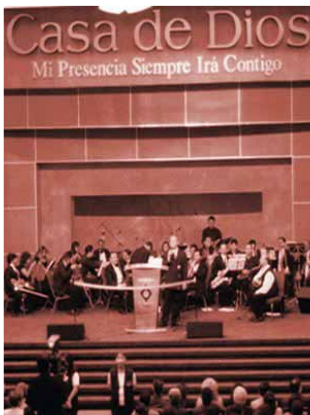
(*) Casa de Dios es la iglesia de Cash Luna

“Según información recabada, Cash Luna fue acusado en cierto momento por varios pastores de cargar con sus ovejas y a través de doctrinas dudosas engatusarlos. Un pastor consultado, informó que Cash utilizando las famosas células, que son reuniones en casas donde se invita a diferentes personas, recluta a ovejas de otras iglesias y es allí donde como por arte de magia crece Casa de Dios”(*) (12)