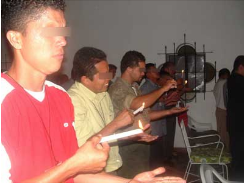
“Literalmente quemándose por “las almas”

El estar embriagado en el “espíritu”, es práctica común en todos los “encuentros”. No nos podemos imaginar a Jesucristo y a sus discípulos echados en el piso, “borrachos” en el espíritu. Sencillamente, eso no va de acorde a la Palabra de Dios, donde allí se nos insta a hacerlo todo “decentemente y con orden” (1 Cor. 14: 40)